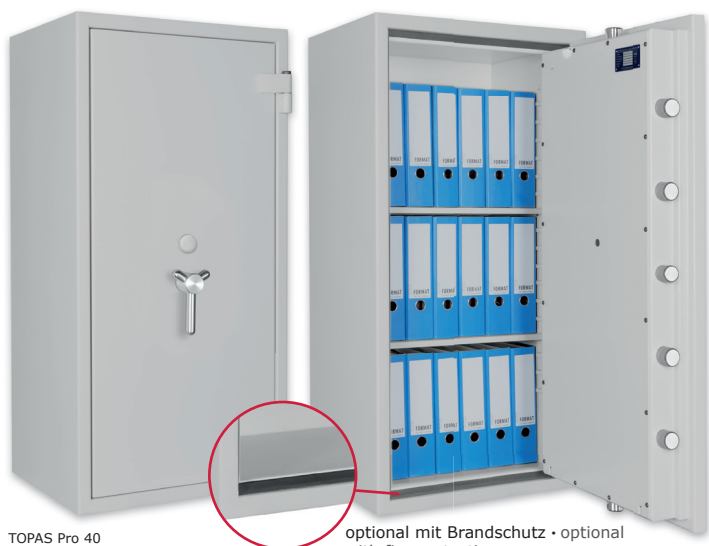
TOPAS Pro 40 Lichtgrau • light grey

optional mit Brandschutz • optional with fire protection