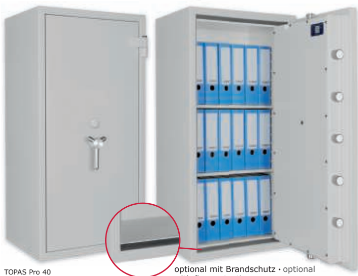
TOPAS Pro 40 Lichtgrau • light grey optional mit Brandschutz • optional with fire protection Dekoration nicht im Lieferumfang enthalten • decoration not included in the delivery

Wertschutzschrank, Grad II (EN 1143-1) Safe, Grade II (EN 1143-1)