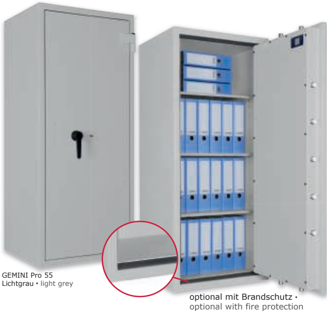
GEMINI Pro 55 Lichtgrau • light grey

Wertschutzschrank, Grad I (EN 1143-1) Safe, Grade I (EN 1143-1)