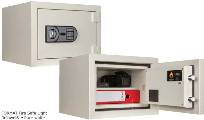
FORMAT Fire Safe Light Reinweiß • Pure white

Dekoration nicht im Lieferumfang enthalten • decoration not included in the delivery