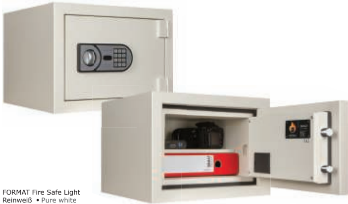
FORMAT Fire Safe Light Reinweiß • Pure white

Dekoration nicht im Lieferumfang enthalten • decoration not included in the delivery